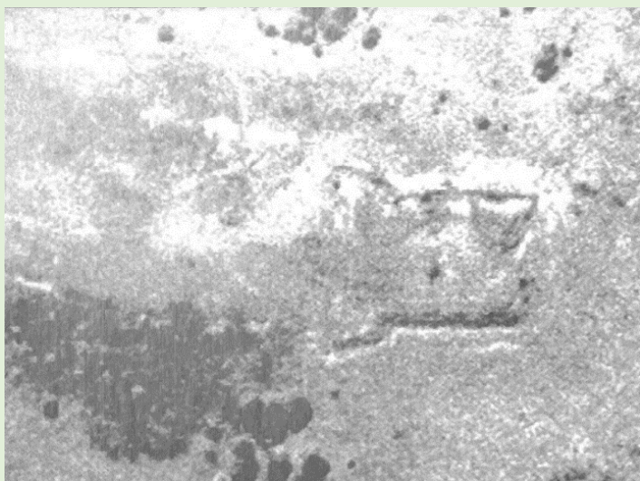
Erentsuko gotorlekua 1938an